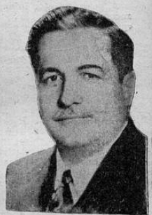
Gral JUAN ANDREW ALMAZAN